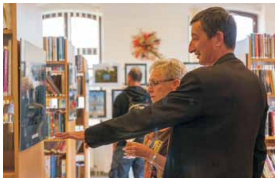
vernisáž „Zlaté Stříbro“ (knihovna)

Výpůjční doba Městské knihovny se od 1.9. mění z prázdninové na běžnou. Sobotní provoz bude zahájen až 13.9.